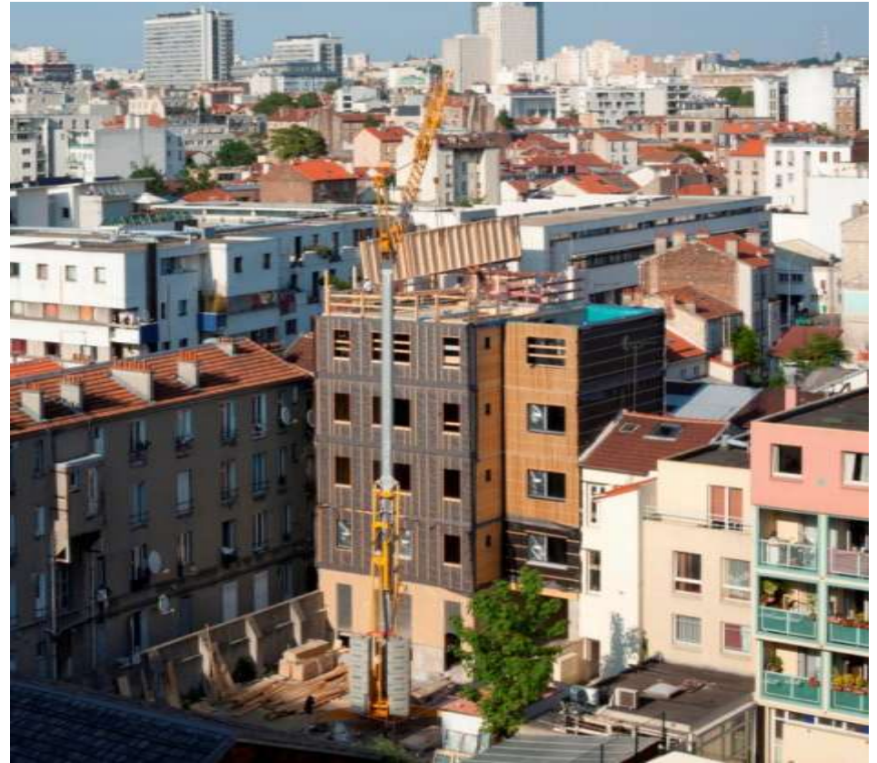
Plancher bois, enveloppe ossature bois